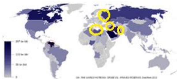
Fig. 4. Zonele cu cele mai mari rezerve de petrol[6] și zonele recente de conflict încercuite cu galben de autori.

Zonele cu cele mai mari rezerve de petrol rezultă din Fig. 4[6].