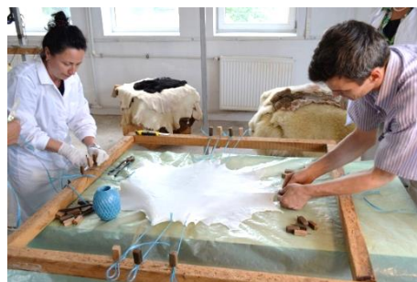
Imaginea 1. Obținerea pergamentului în Atelierul de fabricare a pergamentului, INCDDP-ICPI, București: îndepărtarea părului utilizând un chișlău și un cuțit în formă de semilună cu mânere de lemn; întinderea pergamentului ud pe rama de lemn și tensionarea