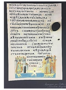
Imaginea 3. Realizarea unei decorații de tip folio pentru o copertă din pergament; pagină facsimil a manuscrisului grec 1294 păstrat la Biblioteca Academiei Române; reproducerea unei miniaturi din Psaltirea de la Dragomirna, 1616